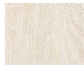
Blanc de Chine