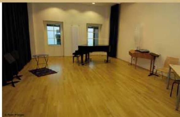
Salle de chants

Cette sous-couche technique a été appliquée pour les parquets de salles de danse en sapin. Elle permet de durcir les fibres du bois sur la zone qui subit des contraintes mécaniques. Son aspect naturel préserve les tons clairs du bois.