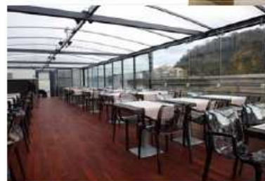
3 ème Prix

Retrouvez les photo des chantiers Plastor et toutes les informations sur nos gammes de produits sur www.plastor.com