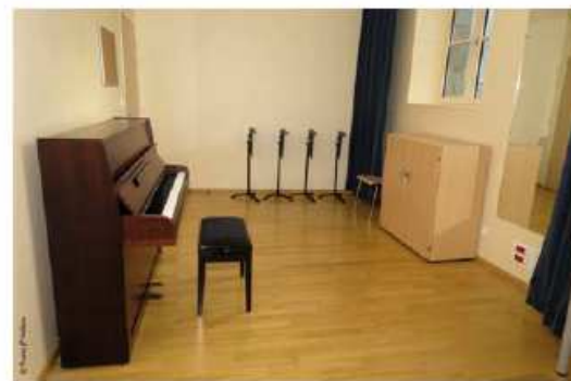
Salle de cordes