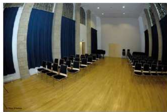
Salle La chapelle