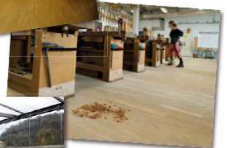
2 ème Prix