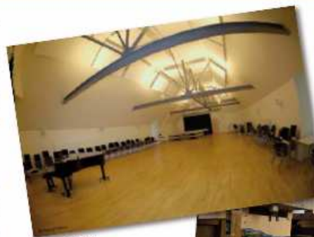
1 er Prix

3 ème Prix : Le Pearl - restaurant Péniche - à Lyon réalisé par l'entreprise SMS JARRY